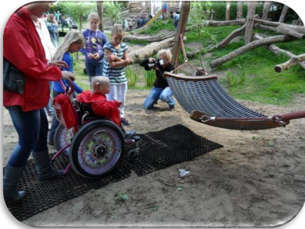
Rubberen matten maken het mogelijk tot bij het speeltoestel te komen. De matten zijn makkelijk verplaatsbaar.