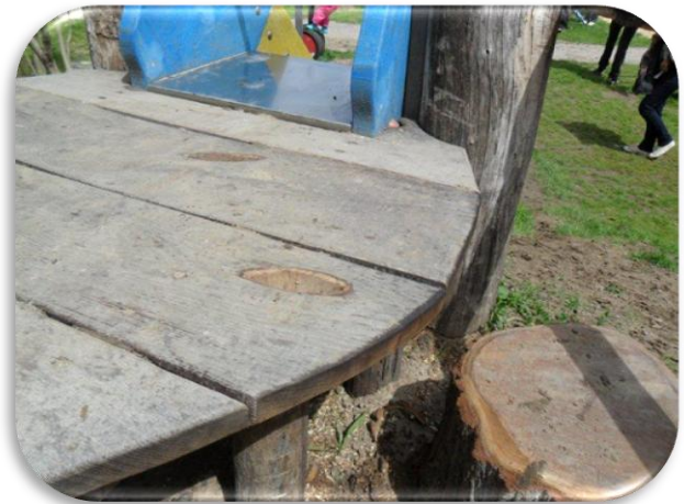
Twee stapstronken plus twee handgrepen in plateau voor extra steun en grip.