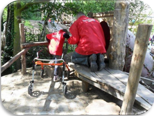
Ook opstapblok links.