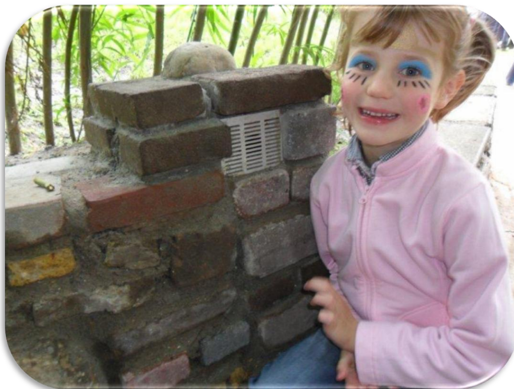
En .....twee super leuke fluisterpalen geplaatst!