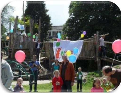
Leuning tussen overgang brug - toren. Leuning langs de trap naar beneden.