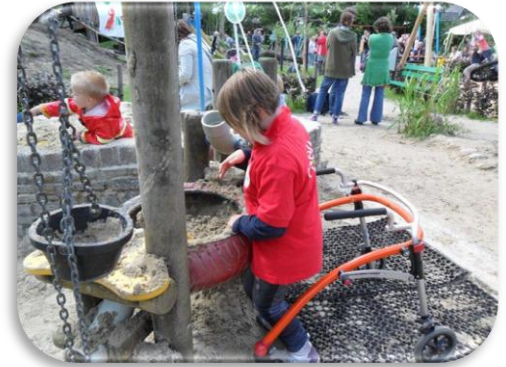
Rubberen matten maken het mogelijk over het zand tot bij de zanddraak te komen en lekker te spelen.