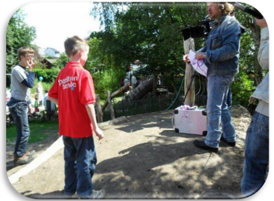
Pad komt uit op groot plateau naast de toren waar je kunt uitkijken over de speeltuin én kunt draaien.