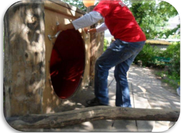
Handgrepen voor extra steun